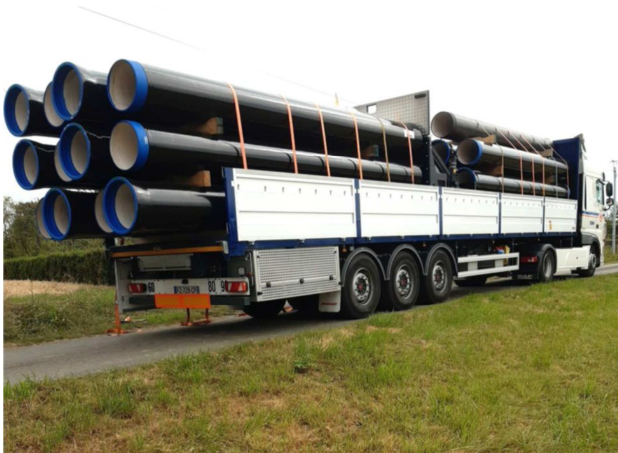
1 ère livraison de tuyaux à La Poitevinière

Les travaux vont se dérouler de septembre à novembre 2021. A noter que la route départementale RD15 entre La Poitevinière et le Pin-en-Mauges sera barrée pendant la semaine du 6 au 10 septembre.