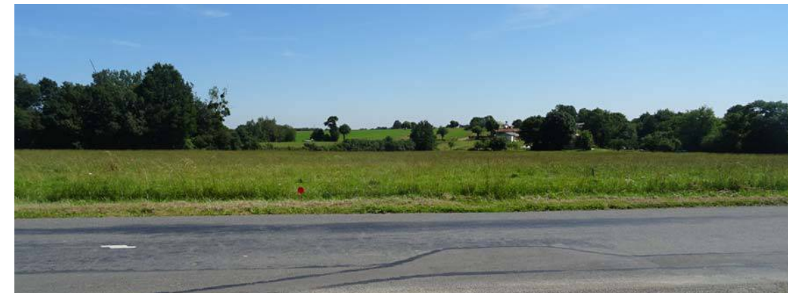
PA6 - 4 / Vue sur le site depuis l'avenue de l'Anjou