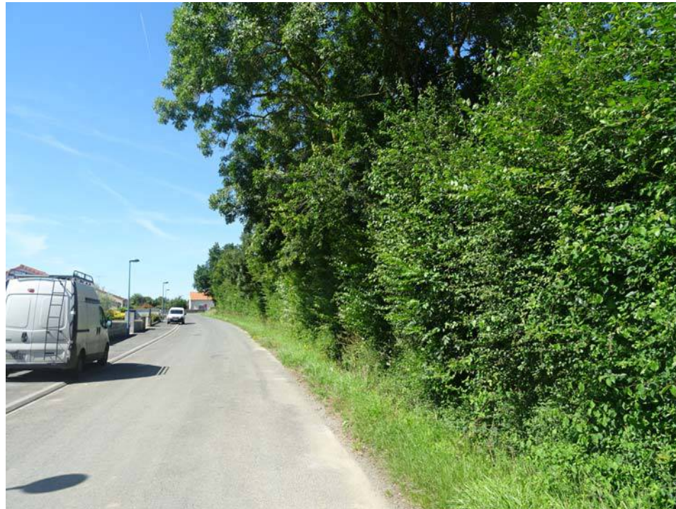
PA6 - 2 / Vue depuis le chemin de la Sablière sur la haie bocagère située en frange sud-est du site