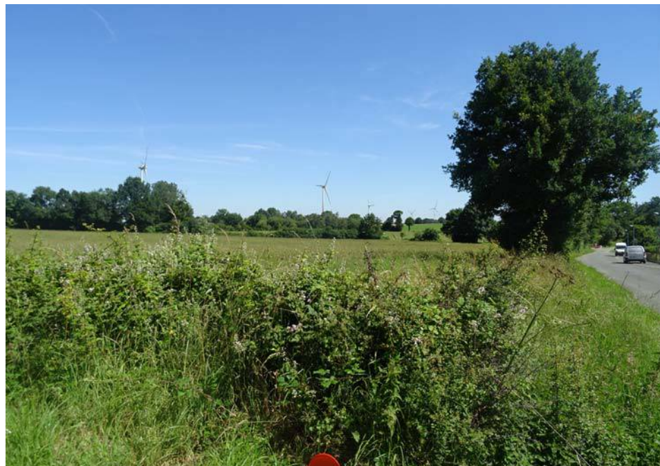
PA6 - 3 / Vue sur le site depuis l'intersection entre l'Avenue de l'Anjou et le chemin de la Sablière