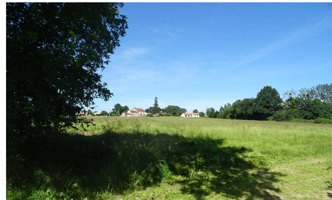
PA6 - 1 / Vue sur le site depuis le chemin de la Sablière et le hameau de la gare en fond de perspective